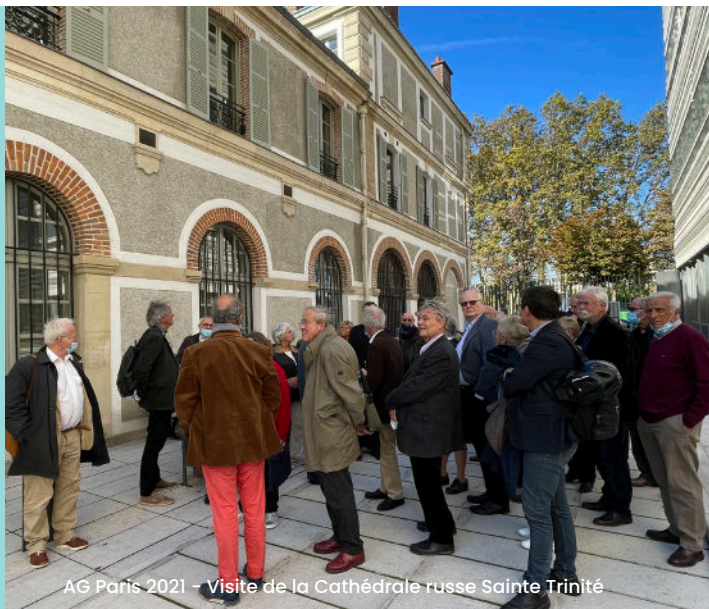
AG Paris 2021 - Visite de la Cathédrale russe Sainte Trinité

L'association est ouverte à tous les collaborateurs, les cadres, encore en activité ou proches de la retraite, ayant été salariés des EPL, de la SCET et/ou de ses filiales.