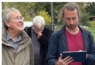
Paris 2021 - Visite guidée de la Cité Universitaire