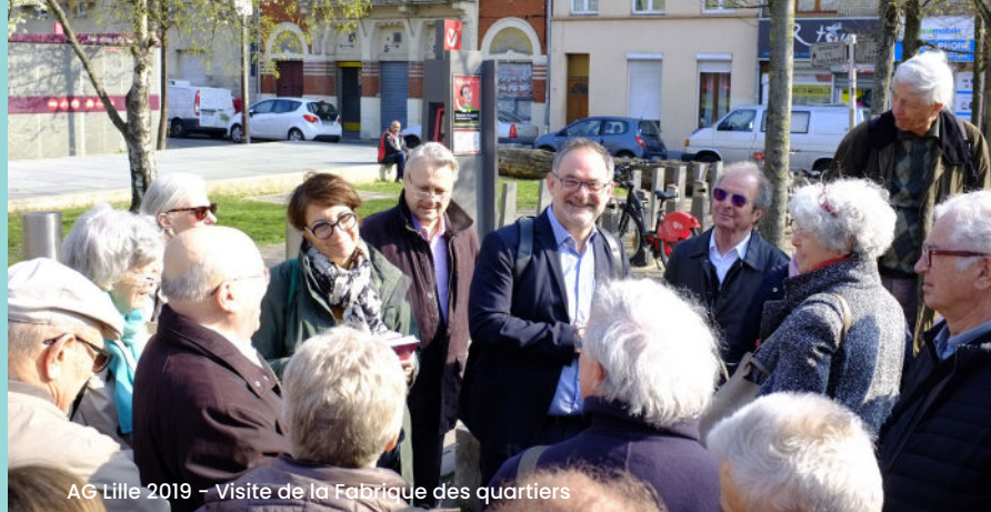
AG Lille 2019 - Visite de la Fabrique des quartiers

C'est là l'occasion de retrouvailles chaleureuses, studieuses et festives !