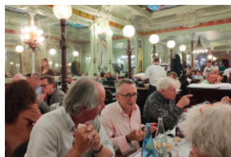
Paris 2021 Dîner au Bouillon Julien

Pour certains de ces travaux l'ARSEPL collabore aussi avec l'Union Atrium.