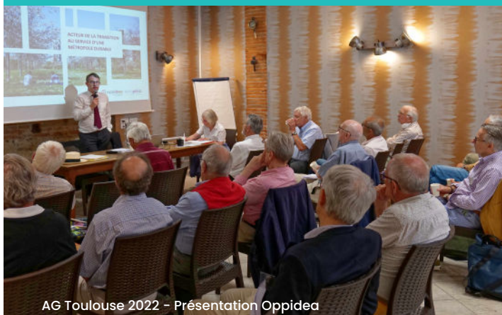
AG Toulouse 2022 - Présentation Oppidea