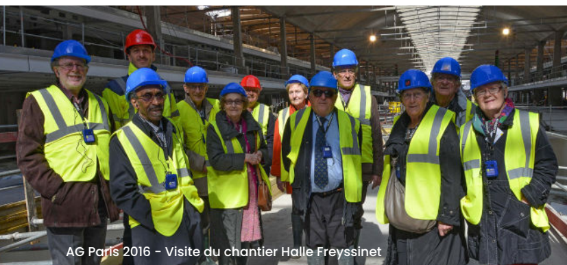
AG Paris 2016 - Visite du chantier Halle Freyssinet

L'ARSEPL participe à la rédaction d'ouvrages publiés par la SCET et consacrés à son histoire ainsi qu'à celle des EPL de son réseau.