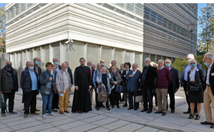
Paris 2021 - Les participants devant la Cathédrale Russe Sainte Trinité

L'ARSEPL informe également ses adhérents via son bulletin "ARSEPL infos, La lettre des adhérents de l'Arsepl", diffusé par e-mailing.